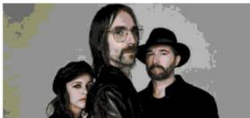
I Baustelle. Nella foto a destra, Lucio Dalla (4 marzo 1943 - 1 marzo 2012)

Era particolarmente attento ai nuovi talenti, Lucio Dalla, ai giovani autori, basti pensare a Luca Carboni e Samuele Bersani che, attraverso la sua personale casa discografica Pressing Line, che oggi definiremmo "indipendente", faceva crescere sino ai portarli ai vertici della classifiche. Una missione che proprio quell'etichetta, insieme alla Fondazione a lui intitolata e a iCompany, con la media partnership di Qn-Il Resto del Carlino, ha fatto nascere CIAO, Rassegna Lucio Dalla per le forme innovative di musica e creatività che, per la seconda volta, andrà in scena nella sua città, Bologna, il 4 marzo, per festeggiare l'anniversario della sua nascita. Sul palco del Teatro Celebrazioni verranno infatti premiati i vincitori selezionati da una ampia giuria di 150 giornalisti e operatori culturali, all'interno di cinque cate-