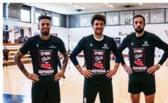
Daniel Hackett, Alessandro Pajola e capitano Marco Belinelli con le maglie Macron