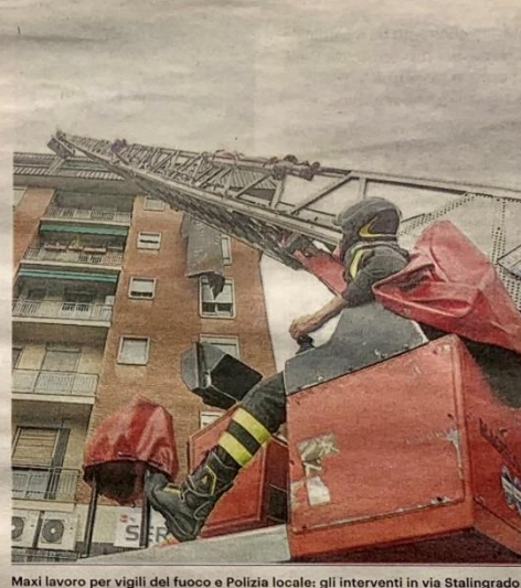
Maxi lavoro per vigili del fuoco e Polizia locale: gli interventi in via Stalingrado